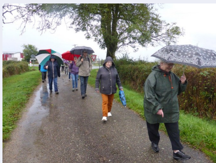
Balade Montmarault le 24 octobre