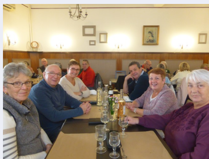
Balade Varennes le 21 novembre